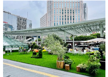
前回の OPEN PARK #01 エキマエの様子

内容：30日（土）は、横浜市が実施する交通転換に関する社会実験の一環として、南幸橋上を一時的に車両通行止めになります。同橋上において、フラワーゲートとOPEN PARK #01でも人気を集めたくまのトピアリーを展開することで、単なる規制にとどまらず、人々の回遊や滞留を生み出す「賑わいの入口」として、「居心地の良い空間」を創出します。