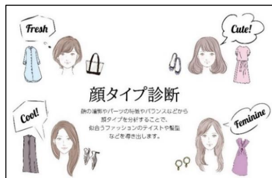
「顔タイプ診断 ® 」(イメージ)

『プロが指南！「自分映え」スタイル』をテーマに、相鉄ジョイナス、横浜モアーズ、横浜タカシマヤがおすすめするブランドの最新春ファッションと、横浜fカレッジの学生が制作した作品を紹介する動画を制作。期間中、横浜駅西口エリアの商業施設(相鉄ジョイナス・横浜モアーズ・横浜タカシマヤ・ニューマン横浜)において、館内サインページやSNSで公開します。動画内では、メディアに多数ご出演し、5,000人以上をプロデュースした、(一社)日本顔タイプ診断協会理事長の岡田実子さんがタイプ別に診断し、ファッションのポイントをわかりやすく解説します。